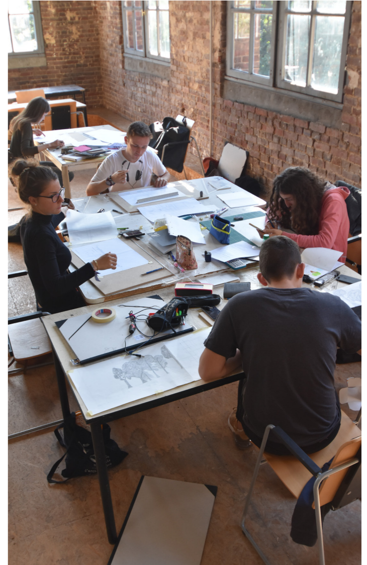
Atelier de travail

• Via les ambassades de France ou les écoles nationales supérieures d'architecture : Pour les candidats étrangers ne relevant pas d'un pays à procédure "Centre pour les Etudes en France" ou résidents en France. Le dossier est disponible dans les services culturels des ambassades de France à l'étranger, les écoles nationales supérieures d'architecture.