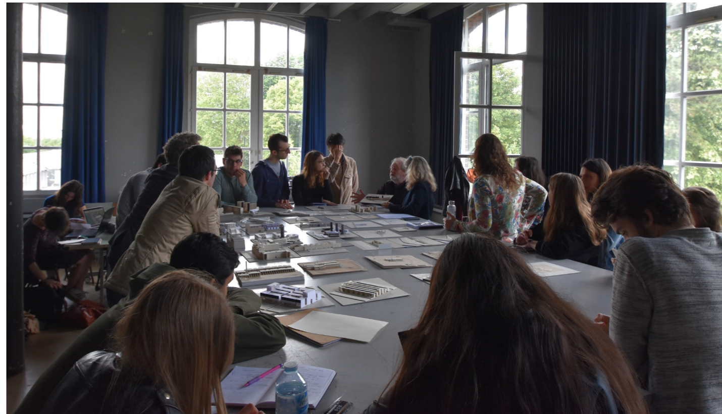
TD So8

Diplôme => Diplôme national de doctorat.