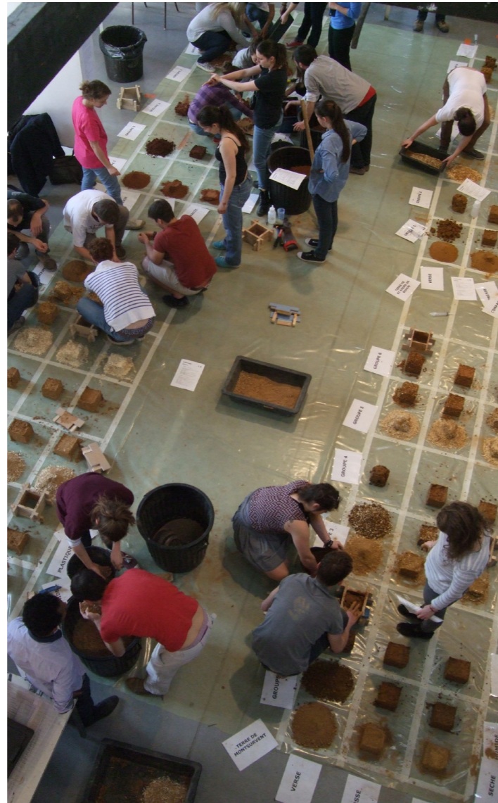
Travaux d'étudiants © ENSA Normandie