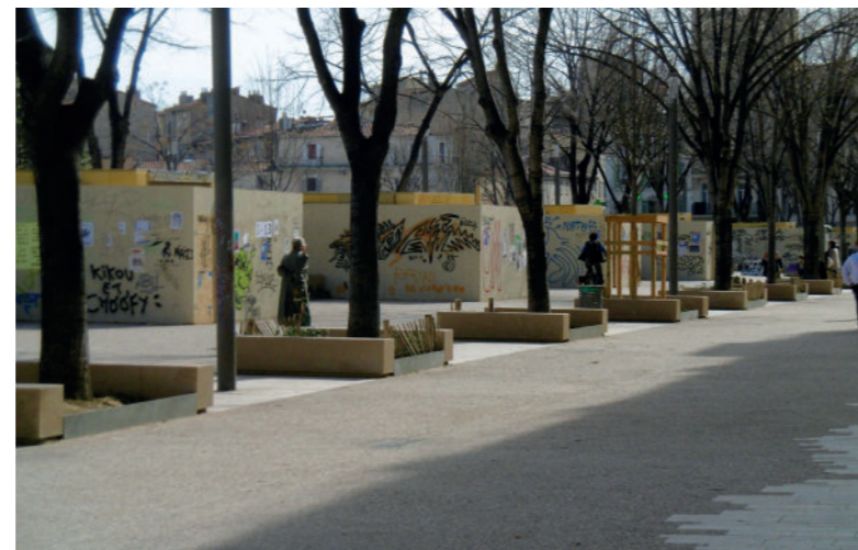
Marseille, chantier d'aménagement de la place Jean-Jaurès, 14 mars 2020

Après avoir présenté les enjeux d'une telle démarche critique, je proposerai un aperçu des questions de méthode souvent complexes qu'elle pose avant de donner quelques exemples applicatifs.