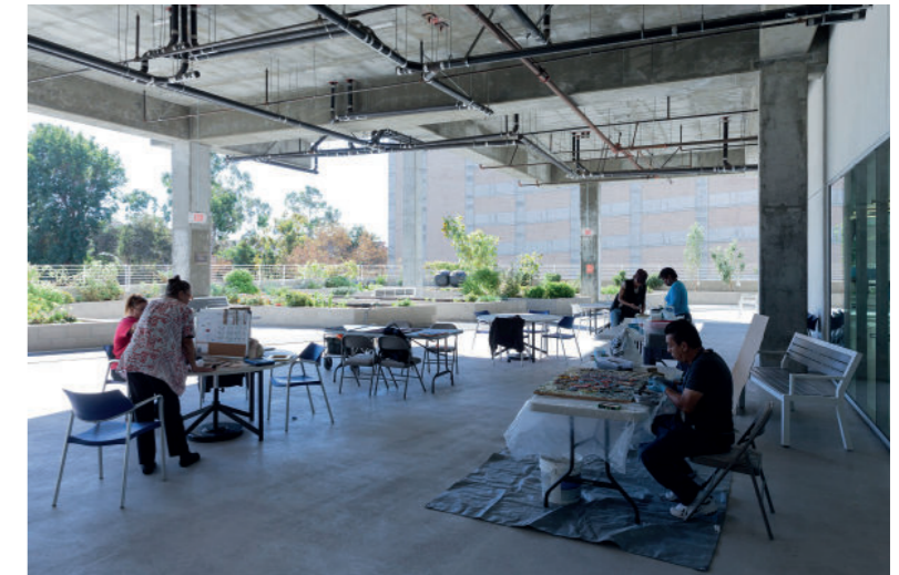
Michael Maltzan Architecture, 2013, Star Apartments, Los Angeles, USA.

Au delà de son acceptation courante comme lieu accessible à tous, l'espace public recouvre aussi depuis les travaux de Jürgen Habermas une notion désignant les lieux par lesquels se forme une opinion publique. L'architecture en tant que discipline productrice de lieux, mais aussi comme pratique génératrice de dynamiques sociales et d'objets symboliques, possède un rôle dans la création ou le maintien de cette sphère publique. Quels sont alors les outils et dispositifs spatiaux ou techniques dont disposent les architectes contemporains pour penser, pratiquer et produire ces lieux de performativité politique nécessaire à la construction démocratique ? La présentation explorera différents exemples de démarches individuelles ou collectives démontrant une expression de cet espace relationnel dans l'espace architectural.