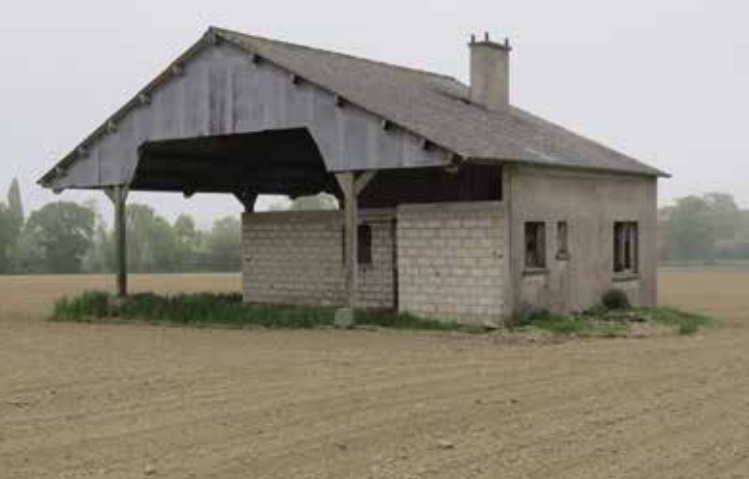
Ferme à Lassy, architecte Stanislas Sainz.