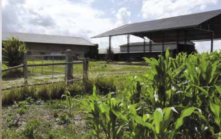
Ferme à Tilly-la-Campagne, architecte Pierre Orième.

Du grand chantier de la Reconstruction, il reste un important patrimoine construit.